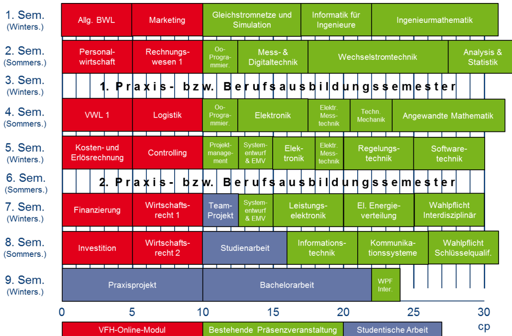
Abbildung 3: Curriculum des Studiengangs WEITiP

In den Praxissemestern, die in der Regel im dritten und sechsten Semester des Studiengangs WEITiP stattfinden (s. Abb. 3), werden keine Leistungspunkte erworben. Am Ende des zweiten Praxissemesters erwerben die Studierenden, die eine Berufsausbildung absolvieren, ihren Facharbeiterbrief.