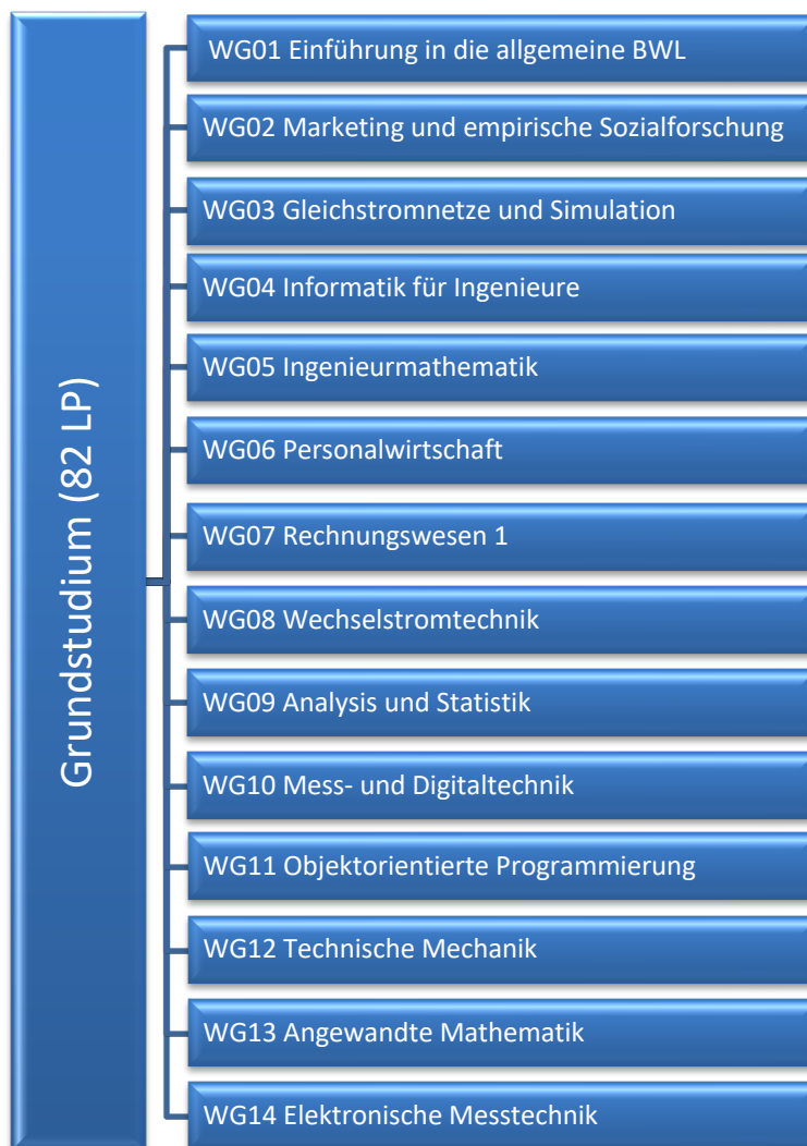
Abbildung 4: Modularer Aufbau des Grundstudiums

Der Umfang des Grundstudiums umfasst 14 Module, siehe Abb. 4. Die zusammengefassten Prüfungsergebnisse des Grundstudiums gehen mit einer Gewichtung von zehn Prozent als eine Note in die Durchschnittsnote der Bachelorprüfung ein.